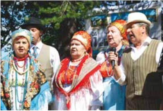
Yhtye "Karelskaja gornitsa" laulamassa «Kiitehenjärvi»-laulua karjalan kielellä Petrunpäivänä. Pyhien apostolien Pietarin ja Paavalin päivä Akonlahdessa v. 2014