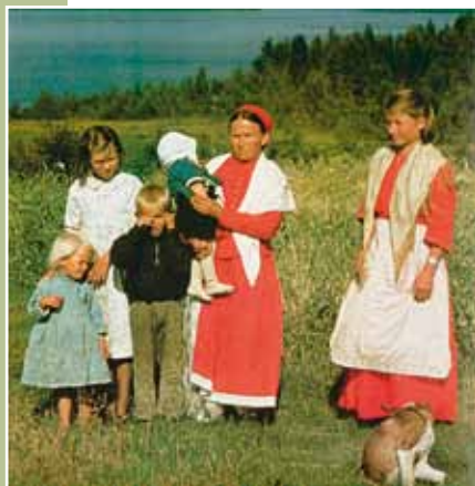
Perhe Tetriniemen kylästä