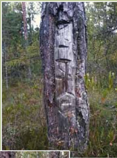
Saaliskarsikot tehtiin onnistuneen metsästyksen paikalle

Karsikon tekeminen oli sekä perheperinteenä että henkilökohtaisena asiana. Joskus puun karsintaan osallistuivat kaikki kyläläiset. Samalla pidettiin, että karsikkopuut edistävät ihmisten onnea ja menestystä sekä auttavat kaikissa asioissa.