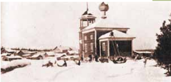
Akonlahden kirkko, v. 1915