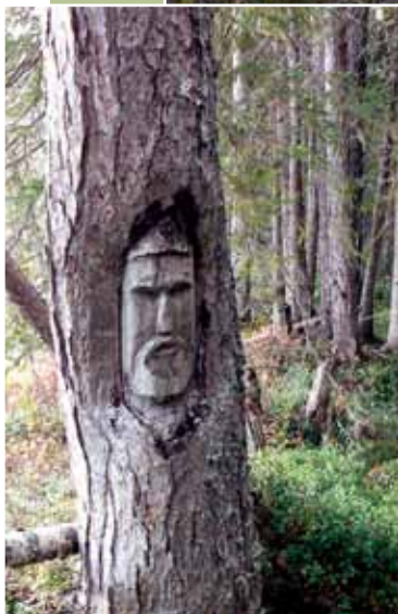
Nykypäivinä tehty karsikko

Useimmiten karsikko oli karsittu havupuu, sillä havupuut ovat kestävämpiä kuin lehtipuut