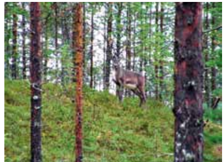
Neitisaari on metsäpeuran suosima paikka