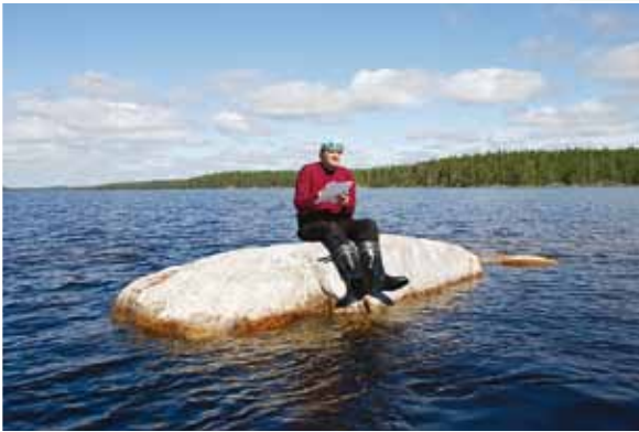
Elias Lönnrotin kivi. Kalevala-epoksen runojen lausuminen (teatterinäytös Petrunpäivänä)