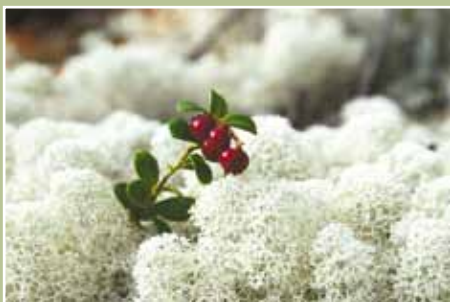
Poronjäkäliä ja puolukoita