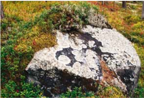
Jäkälien peittämä kuvio kiven pinnalla