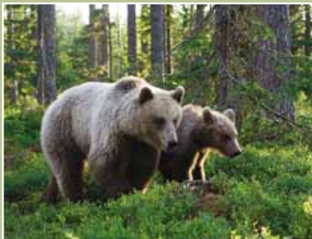
Karhunaaras ja 1-vuoden ikäinen pentu