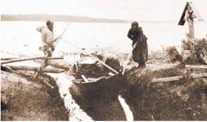
Sappovaaran kanava, v.1894